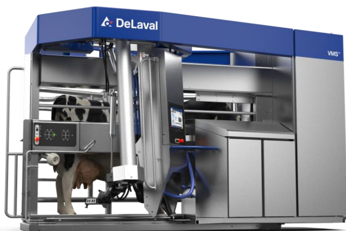
Bild: DeLaval Melkroboter VMS™ V300: Intelligenter, schneller, schonender und flexibler als je zuvor

All diese Lösungen können Besucherinnen und Besucher auf dem DeLaval Stand bei den LandTagenNord in Wüstring erleben: 21.-24. August 2026, Stand G1