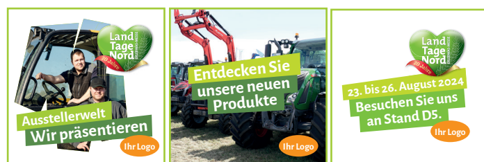
3er Slide Post

Ein Stummvideo mit 15 Sek. Länge, wird von morbitzer media mit Musik und Frame oder drei Slides mit Frame hinterlegt und in Kooperation mit den LandTagen gepostet.