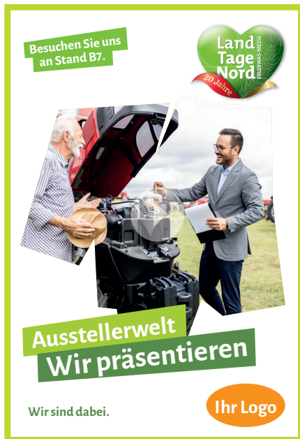
Bewegtbild / Video-Post Instagram Story

Dieses Paket bietet zusätzlich zu Paket 2 einen Drohnen-Video/Post und einen Nachbericht als Collab per Social Media. Während der Messe macht das Videografen Team von uns ein Drohnen-Video vom Stand und