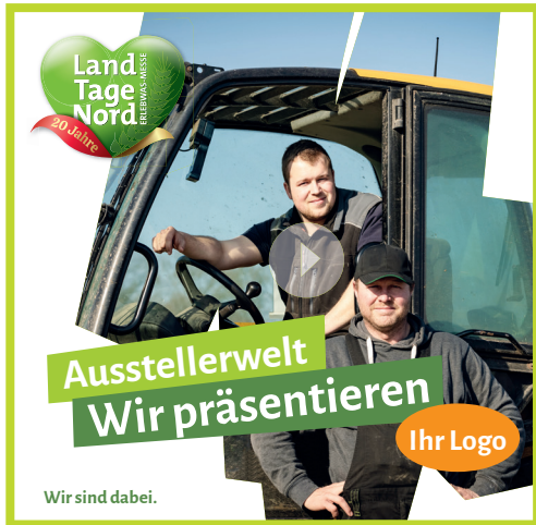
Bewegtbild / Video Post

Social Media Paket: Aufmerksamkeit erzeugen.