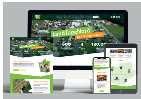
Redaktioneller Beitrag Webseite

die Aufmerksamkeit aller Interessierten zu gewinnen und die Attraktivität und Reichweite zu steigern.