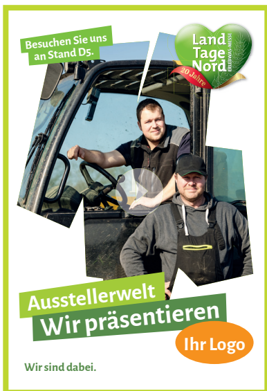
Bewegtbild / Video Post Instagram Story

Ein Collab Post ist ein einzelner Post, der im Feed oder den Reels zweier verschiedener Nutzer erscheint. Collab Posts werden an zwei Stellen gleichzeitig angezeigt und haben auch Kommentare, Likes und die Anzahl der Shares gemeinsam.