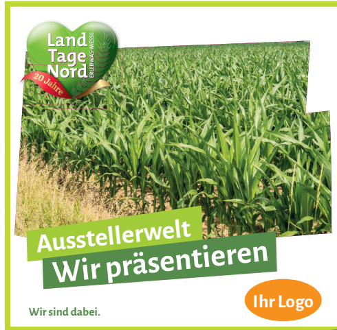
Beispiel Bewegtbild / Video-Post

Das Gold Paket bietet die Möglichkeit, zusätzlich zu den umfangreichen Social Media Paketen, einen redaktionellen Beitrag abzugeben. Dieser erscheint auf der Webseite der LandTageNord